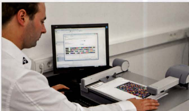
Die Color Alliance bietet ihren Kunden einen neuen Profilerungs-Service, wenn ein benötigtes Farbprofil nicht auf der CA-Datenbank ist.

Das Ziel ist, mit einem einfachen und sicheren Color Management den Workflow