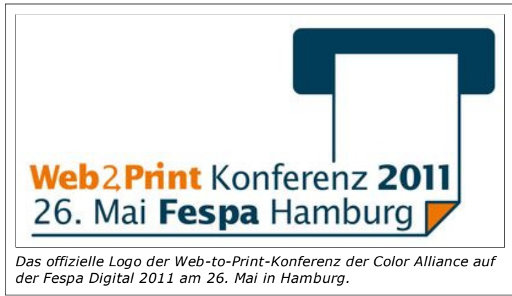
Das offizielle Logo der Web-to-Print-Konferenz der Color Alliance auf der Fespa Digital 2011 am 26. Mai in Hamburg.

Zahlen und Fakten zu LFP - Auf der Fespa Digital 2011 in Hamburg hält Bernd Zipper, der führende Experte im Bereich Web-to-Print, einen Vortrag zu diesem Thema. Im Fokus dabei steht Web-to-Print als Unternehmensstrategie. Der Web-to-Print-Fachmann zeigt auf, wie Druckdienstleister ihr Angebot erweitern und Profit daraus schlagen können.