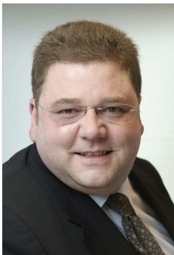
Der führende Web-to-Print-Experte kommt zur Konferenz: Fespa Digital 2011 in Hamburg, 26. Mai, Raum A2.1.