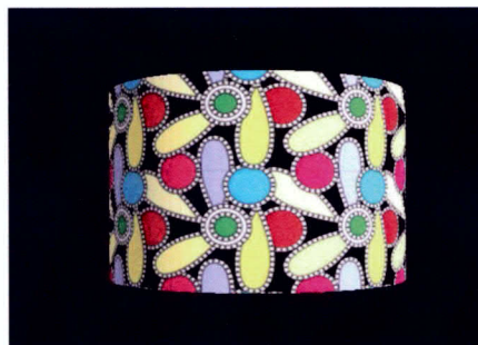
3D Vorschau eines Lampenschirms – Die 3D Ansicht im ca|smartEDITOR ermöglicht es dem Endkunden sich das gerade gestaltete Produkt realitätsnah als Vorschau anzeigen zu lassen. In dieser Preview kann es virtuell gedreht und von allen Seiten betrachtet werden. Diese 3D Vorschau ist für viele Produkte möglich, z.B. Lampenschirme oder Keilrahmen.

Die Color Alliance (CA) ist ein führender Anbieter von Web-to-Print-Software für Druckereibetriebe und LFP-Dienstleister. Der Spezialist für den digitalen Großformatdruck möchte die Heimtextil nutzen, um neue Kunden zu adressieren, die einen hohen Nutzen von den Produkten von Color Alliance haben könnten. Die Color Alliance demonstriert auf der Heimtextil seinen Onlineshop mit Gestaltungsmöglichkeiten für Inneneinrichtungen und Dekoration. Der ca smartshop verfügt über eine 3D-Vorschau für Produkte, die von Endkunden oder anderen Shopbesuchern im ca smarteditor frei gestaltet und anschließend mit der ca watchapp als Augment Reality in der eigenen Wohnung mit dem Apple iPad betrachtet werden